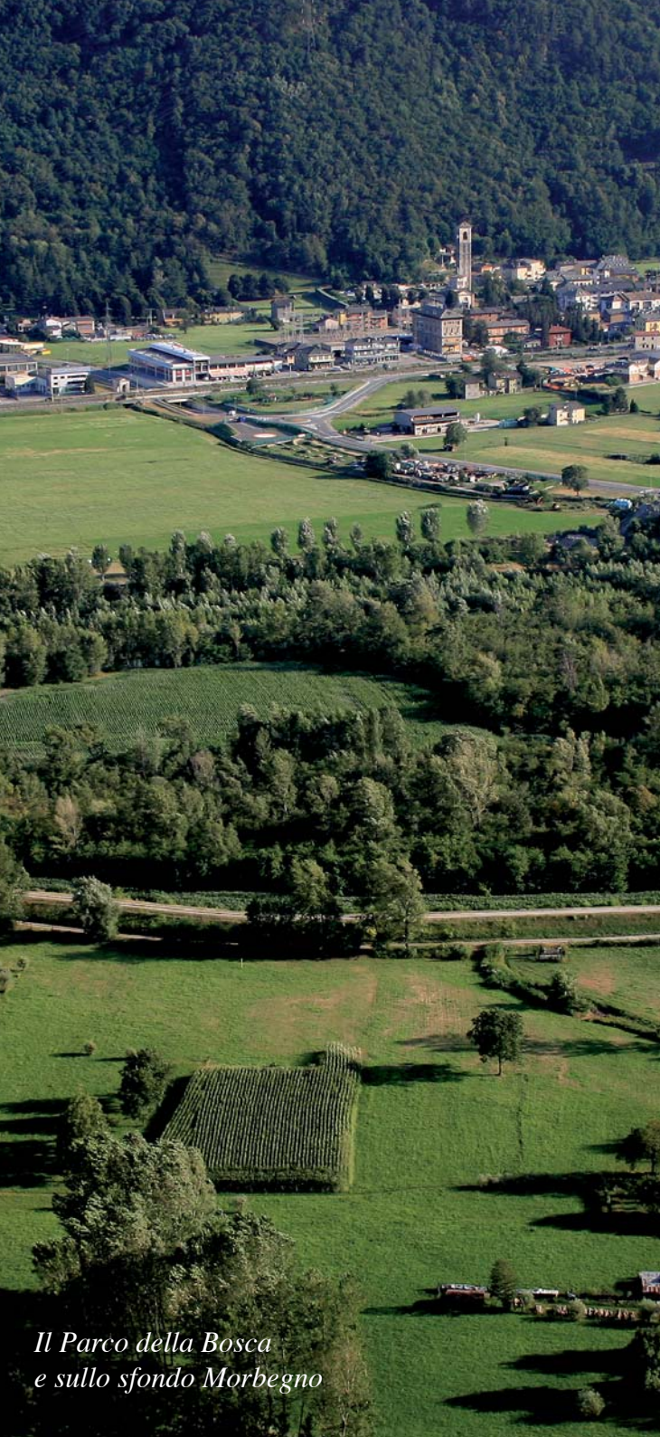
Il Parco della Bosca e sullo sfondo Morbegno