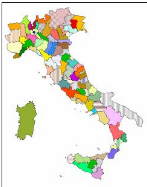
Autorità d'Ambito (1994)