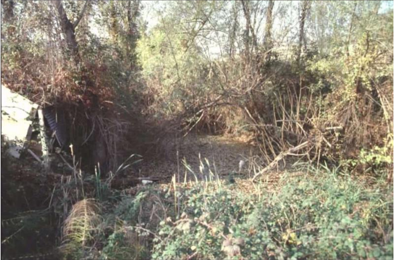
Foto 4 – 5 - Il prelievo delle acque del fosso, quasi sempre effettuato abusivamente, provoca il prosciugamento per lunghi mesi dello stesso. Molte delle pozze e degli stagni presenti (vedi foto) seguono in gran parte la stessa sorte, mentre i rari stagni con acque permanenti spesso sono di fatto privatizzati e recintati, e vengono utilizzati come pescaggio per l'irrigazione. Una adeguata conduzione di queste pozze, di elevato pregio ambientale, consentiranno al fosso un deflusso minimo vitale ecologicamente funzionale.