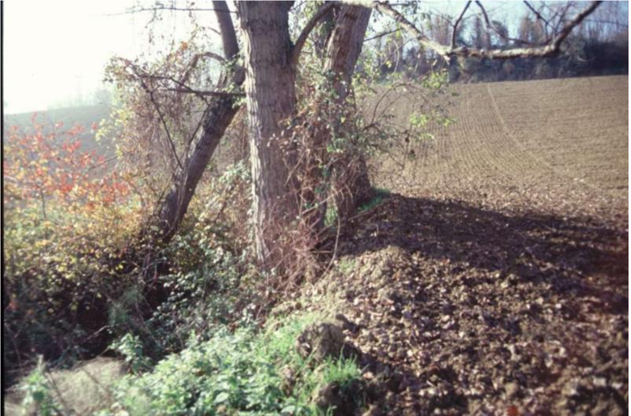
Foto 1 - Piccolo bacino ai margini dell'alveo attivo, che le lavorazioni del suolo sino sul ciglio e la conseguente rimozione della vegetazione ripariale stanno conducendo ad un interrimento; considerazioni di tipo idraulico-ambientale suggeriscono il recupero del bacino.