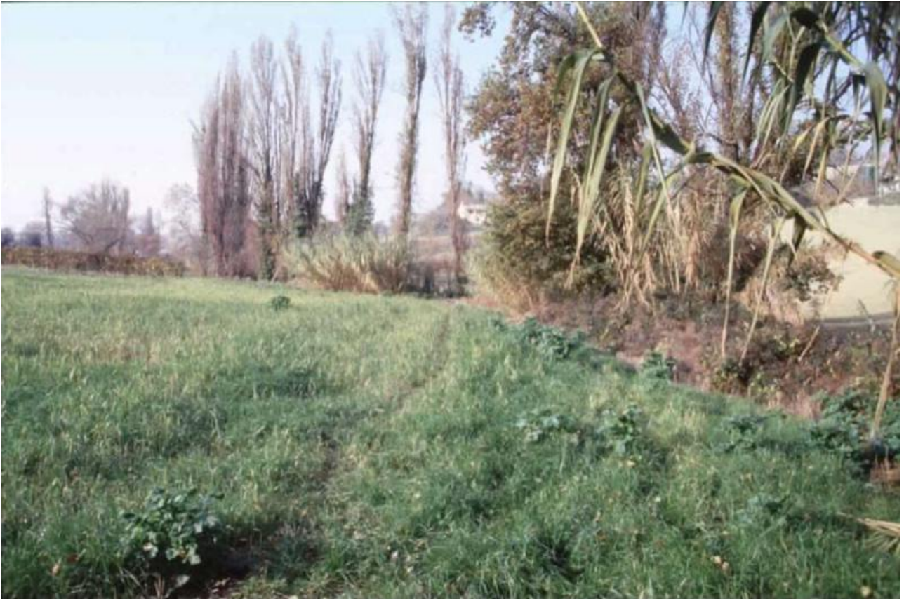
Foto 6 – Tratto d'alveo del fosso invaso da boscaglia o macchia, al cui interno scorre serpeggiando un ridottissimo alveo di magra; si notano i resti degli originari filari a pioppo cipressino.