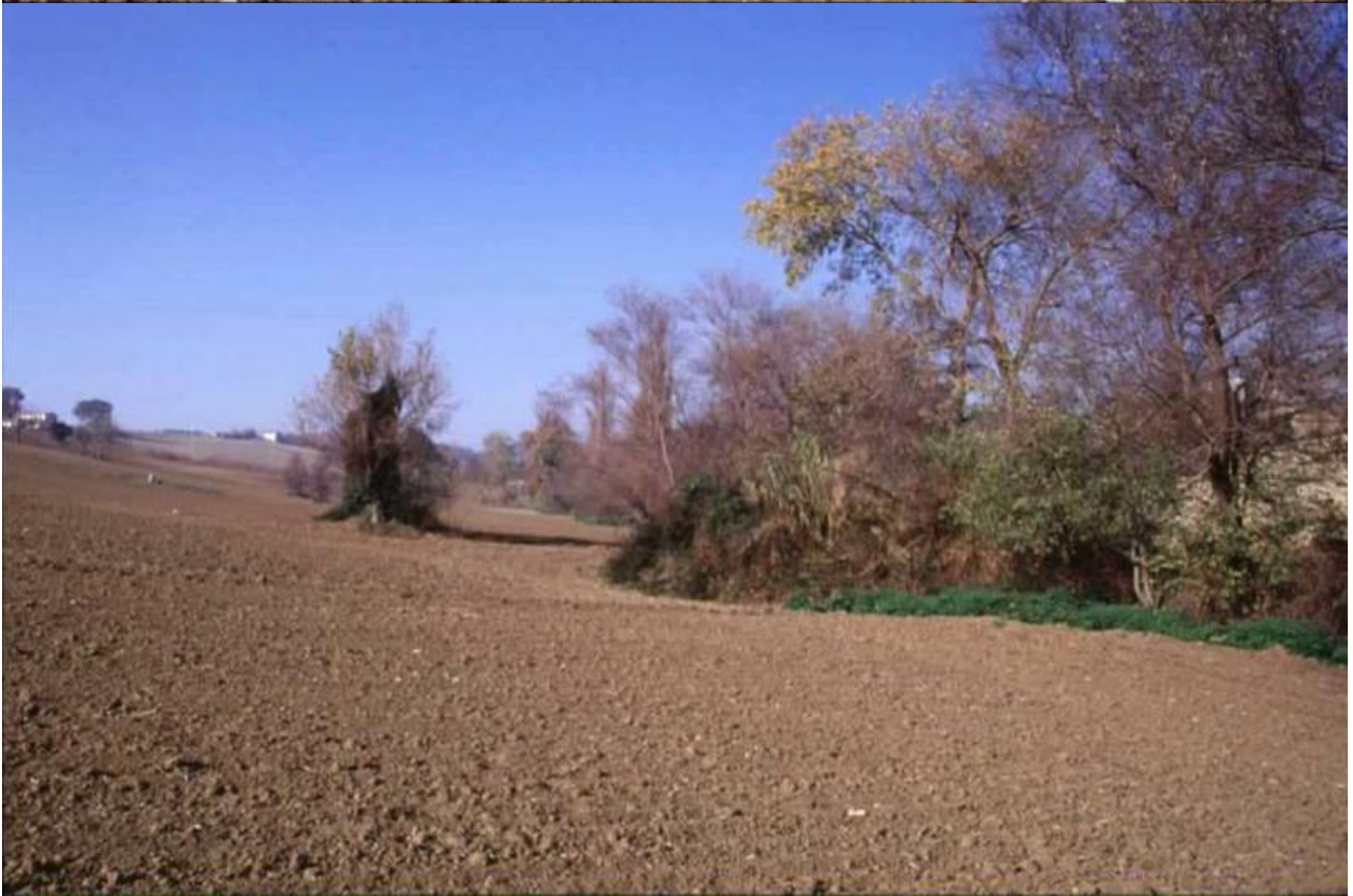
Foto 2 - 3 - Situazione "tipo" del Fosso Acquaticcio: La semplificazione del sistema agricolo (senza siepi, senza fossi permanenti) con lavorazioni del suolo in profondità, condotte sino sul ciglio, rimuovono ogni minima fascia di protezione, e conducono a forte dilavamento del suolo e all'interramento del fosso.